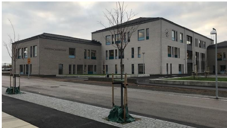
Skolhus 2 Årskurs 5 - 9