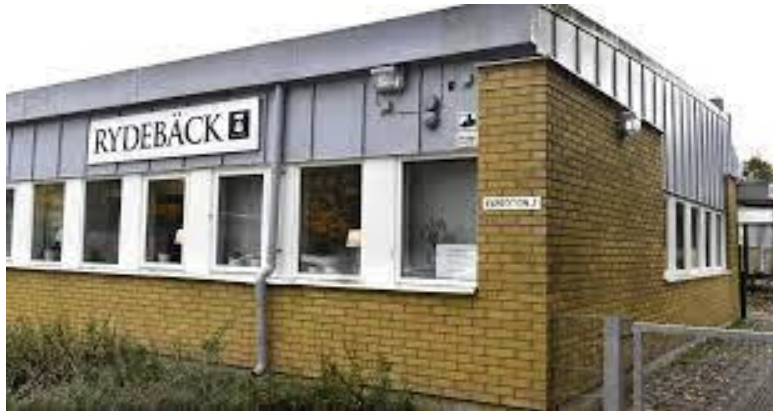
Skolhus 1 Förskoleklass - årskurs 4